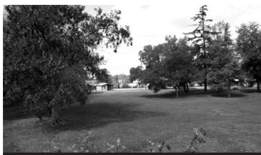
Le parc de 5 hectares