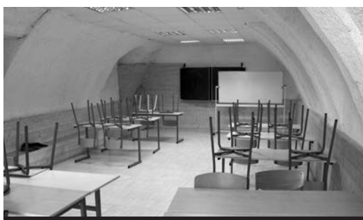
Une autre salle d'activité