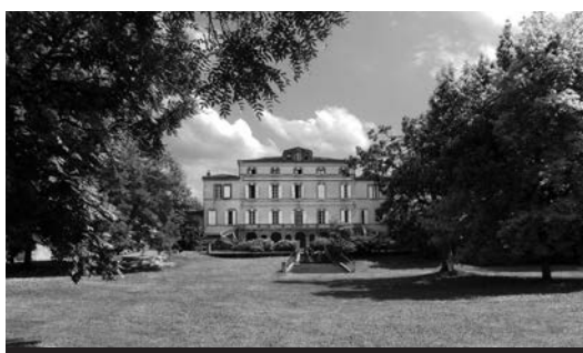
Le château et le parc