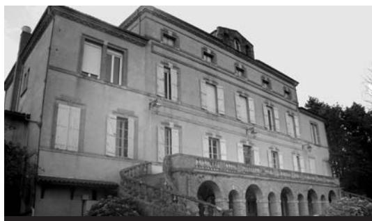
Le château, la terrasse