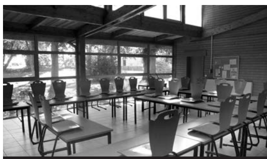
Une salle d'activité