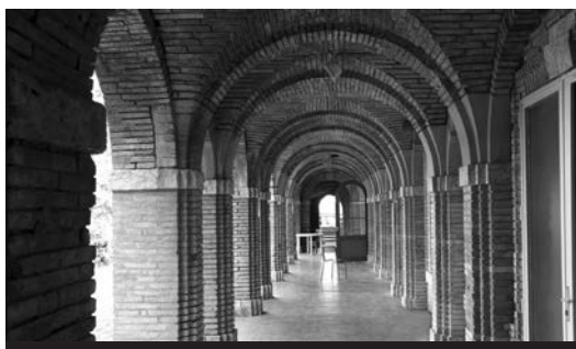
Les arcades au sous-sol